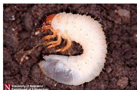
Ver blanc sur le sol.

Deux sortes de vers blancs se nourrissent des racines de maïs. Le vrai hanneton, qui a un cycle de vie de trois ans et le ver blanc annuel qui complète son cycle vital dans une seule année. Les vrais hannetons sont les larves des hannetons communs et infligent plus de dommages au maïs que les vers blancs hannetons annuels. Les vers blancs annuels sont les larves du scarabée japonais. Les deux types sont originaires d'Amérique du Nord et se retrouvent dans la plupart des régions à maïs.