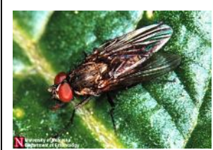
Dessus: Mouche de la légumineuse sur grain de maïs. Dessous: Adultes de mouches de légumineuse.