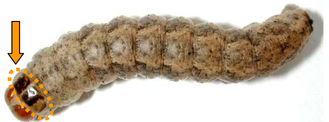
Figure 2. Larve mature avec deux bandes foncées sur le pronotum.