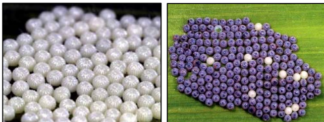
Figure 1. Masse d'œufs fraîchement pondus (gauche) et près à éclore (droite)