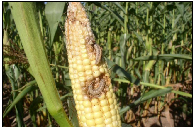
Figure 4. Dommages sur le maïs