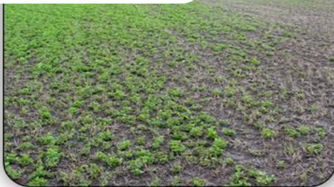
Domage causé par la formation de glace