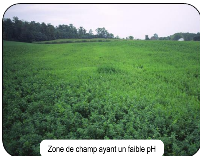
Zone de champ ayant un faible pH